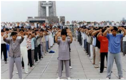
九九九年七·二〇以前唐山广场炼功场面