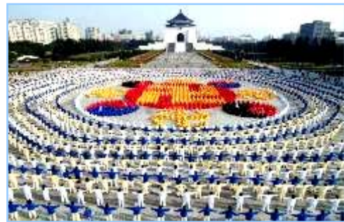
■ 2005年12月25日，台湾4000多名法轮功学员集体炼功，排组法轮图形。

● 洪传世界 法轮功已洪传世界80多个国家和地区，受到世界人民的爱戴和尊敬；给中国赢得巨大的国际声誉。李洪志先生和法轮大法对人类身心健康作出的杰出贡献，获得各国政府褒奖、支持议案信函超过2977项。自2000年起，李洪志先生连续四年被提名诺贝尔和平奖。