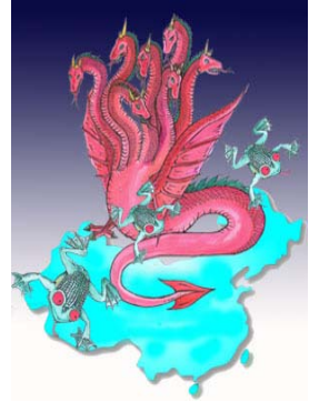
圣经启示录 描述一条“大红 (赤)龙，七头十 角，七头上戴着

从形式上看，大法弟子劝“三退”（退党、退团、退队）过程中并没有鼓动人们必须去找党组织正式提出申请，而是注重于人的心理活动，从内心真诚的以化名、小名（或真名）退出中共党、团、队，废除恶毒誓言、选择心灵救赎，形式上平和，不危害任何人利益，不会引发任何社会波动。大法弟子劝“三退”也好，人们选择“三退”也好，都属于言论自由和思想自由的范畴，根本谈不上违法。“天灭中共，退党保命”完全是有神论的