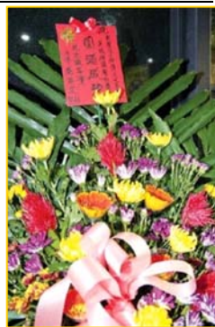
▲ 意犹未尽的挪威观众。▶ 3月25日,台湾的 39 场神韵演出圆满落幕。民进党主席蔡英文致花篮祝贺。