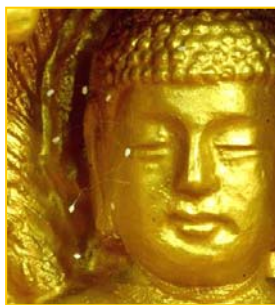
■ 韩国全罗南道须弥山禅院佛像面部的优昙婆罗花。

地,人民的合法权利、言论自由被剥夺,这一切都是不信神佛、战天斗地的中共的邪恶统治带来的恶果。古人云:“善恶到头终有报”,“天灭中共”实乃天意之必然。