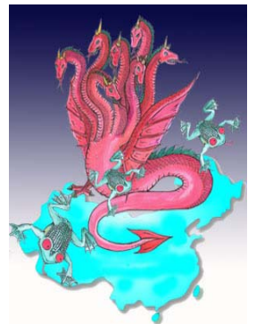
圣经启示录 描述一条“大红 (赤)龙，七头十 角，七头上戴着

从形式上看，大法弟子劝“三退”（退党、退团、退队）过程中并没有鼓动人们必须去找党组织正式提出申请，而是注重于人的心理活动，从内心真诚的以化名、小名（或真名）退出中共党、团、队，废除恶毒誓言、选择心灵救赎，形式上平和，不危害任何人利益，不会引发任何社会波动。大法弟子劝“三退”也好，人们选择“三退”也好，都属于言论自由和思想自由的范畴，根本谈不上违法。“天灭中共，退党保命”完全是有神论的