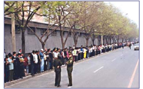
法轮功学员文明安静，警察不用维持秩序，在一旁聊天。学员背后不是中南海红墙，所谓的“围攻中南海”根本不存在。

4•25 当晚，江泽民出于妒忌，强行推翻政府总理的开明决定，把和平上访歪曲成“围攻中南海”，并于 99 年 7 月开始全面迫害法轮功。