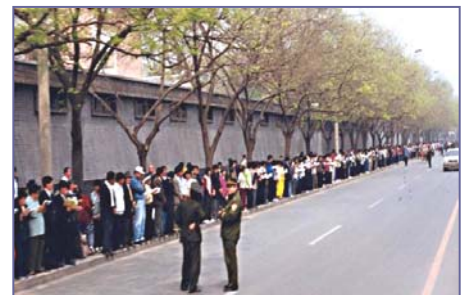
法轮功学员文明安静，警察不用维持秩序，在一旁聊天。学员背后不是中南海红墙，所谓的“围攻中南海”根本不存在。

4•25 当晚，江泽民出于妒忌，强行推翻政府总理的开明决定，把和平上访歪曲成“围攻中南海”，并于 99 年 7 月开始全面迫害法轮功。