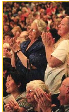
▲ 瑞典斯德哥尔摩 Cirkus 大剧场爆满。▶ 澳洲堪培拉观众为神韵倾倒。