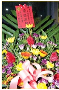
▲ 意犹未尽的挪威观众。▶ 3月25日,台湾的 39 场神韵演出圆满落幕。民进党主席蔡英文致花篮祝贺。