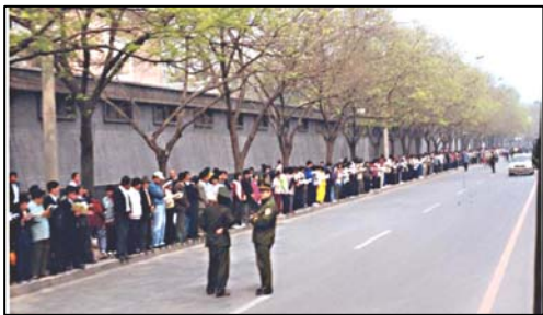
1999年4月25日，万名法轮功学员上访，秩序井然。

说：“大概10点多吧，就是朱总理到机场去送外宾，那么一下看到那么多学员就叫工作人员下去了解情况，