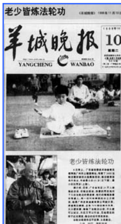
▲5000 多名武汉法轮功学员集体炼功,排组法轮图形和“真善忍”。(1997) 右图:老少皆炼法轮功(《羊城晚报》1998.11.10)