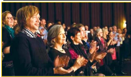
▲ 意犹未尽的挪威观众。▶ 3月25日,台湾的39场神韵演出圆满落幕。民进党主席蔡英文致花篮祝贺。