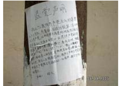
광서남녕거리에 나붙은 “3 퇴”성명

더는 구할수 없기때문이 요. 공산당이 이렇게 부패하니 백성들이 어떻게 살수 있겠는가?》라고 말하고 나서 공개적으로 공산당에서 퇴출할 것을 정중히 제출했다.