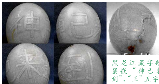
黑龙江藏字鹅蛋嵌“神已来到”、“王”五字。