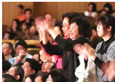
被神韵意境溶浸的台湾观众

充满感恩才会有那种表情。”她说：“我们需要知道我们从哪里来，将要往哪去。今天真的是很感动。”