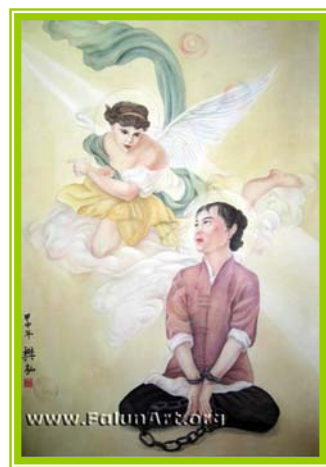
油画锁不住的信念

“全心全意为人民服务”的党是一个赤裸裸的流氓黑帮党。而法轮功学员在恶党酷刑暴虐中所表现的坚贞、无畏、真诚、善良、宽容的高尚精神，也再次见证了“真善忍”的伟大！