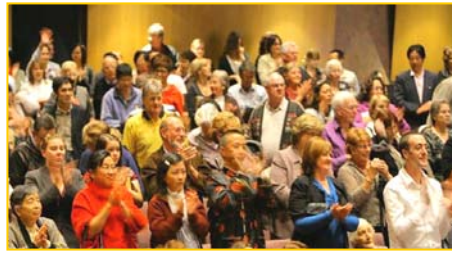
■ 澳洲观众向神韵精彩的演出鼓掌致谢

四月三日神韵国际艺术团光临澳洲季隆，在著名的考斯特剧院献上两天三场演出，神韵展现的中华五千年神传文化精粹，令澳洲观众赞叹连连。