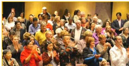
■ 澳洲观众向神韵精彩的演出鼓掌致谢

四月三日神韵国际艺术团光临澳洲季隆，在著名的考斯特剧院献上两天三场演出，神韵展现的中华五千年神传文化精粹，令澳洲观众赞叹连连。