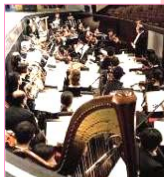
中西合璧神韵艺术团 乐队奏出旷世天音

■ 神韵艺术团乐队以西洋管弦乐器为基础，加上传统中国乐器如二胡、琵琶、古筝、笛子等，使演奏乐曲既发挥西洋管弦乐潜能又富中国民族特色。