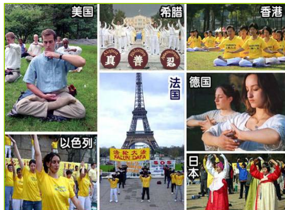
图：不同族裔的法轮功修炼者在炼功

● 洪传世界 法轮功已洪传世界 80 多个国家和地区,受到世界人民的爱戴和尊敬。因李洪志先生和法轮大法对人类身心健康作出的杰出贡献,获得各国政府褒奖、支持议案信函超过 2977 项。法轮功书籍被译成 40 多种语言全球发行。