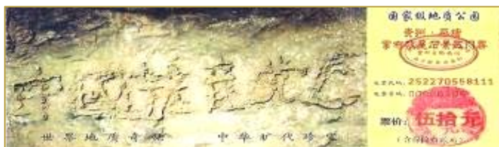
贵州省平塘县掌布乡亿年藏字石天成“中国共产党亡”六个大字。图为国家级地质公园门票。