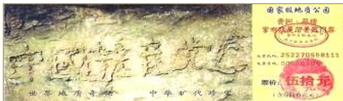
贵州省平塘县掌布乡亿年藏字石天成“中国共产党亡”六个大字。图为国家级地质公园门票。