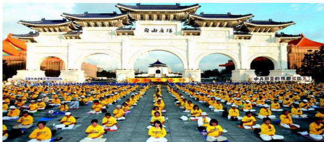
二零零八年十一月四日，三千多名台湾法轮功学员在台北自由广场前炼功，抗议中共迫害法轮功。

所以，法轮大法作为佛家上乘修炼大法，自1992年一经传出后，其修心重德的要求及其健身奇效，立即引起了广大民众的极大兴趣，迅速传遍全国，吸引上亿人修炼；现已洪传世界八十多个国家和地区。仅港、澳、台地区就有几十万人修炼；