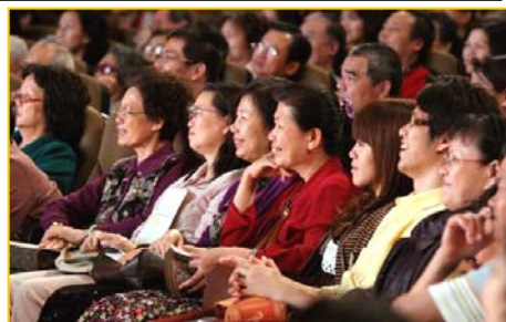
■ 被神韵意境溶浸的台湾观众

气，让心灵非常超脱。演员们已经提升到很灵性的境界，内心充满感恩才会有那种表情。”她说：“我们需要知道我们从哪里来，将要往哪去。今天真的是很感动。”