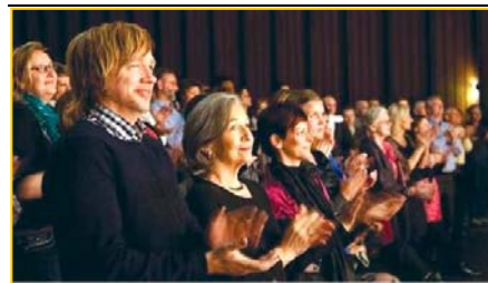
▲ 意犹未尽的挪威观众。▶ 3月25日,台湾的39场神韵演出圆满落幕。民进党主席蔡英文致花篮祝贺。