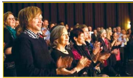
▲ 意犹未尽的挪威观众。▶ 3月25日,台湾的39场神韵演出圆满落幕。民进党主席蔡英文致花篮祝贺。

高压压不住人心，高压封锁不住真相。中共的“司法新底线”必将被正义力量打破。还法轮功司法公正的日子不会太远了。（文／龙延）