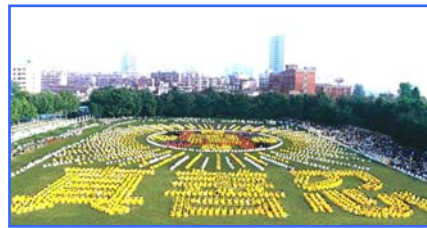
▲ 5000 多名武汉法轮功学员集体炼功，排组法轮图形和“真善忍”。(1997)

● 法轮大法至今已洪传世界 80 多个国家和地区，获得各国政府褒奖、支持议案、信函超过 2977 项。法轮大法的主要著作《转法轮》已被译成 30 多种文字，在全世界出版发行。