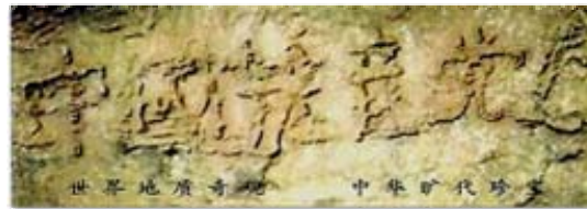
■ 贵州平塘县掌布乡的“藏字石”。

其牺牲品，只有声明退出中共的组织才能废除毒誓，才能在大劫难中保住性命，世界各国有很多古老而著名的预言都提到了当今正在发生的事;2002年6月，贵州平塘县掌布乡发现了2亿7千万年前的藏字石，巨石断面上天然形成六个大字：中国共产党亡(下图)。所以，善待法轮大法，认清中共，退出中共党、团、队，会给自己开创美好的未来。在真相大显之前，每个人还有机会选择自己的未来。