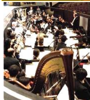
中西合璧神韵艺术团乐队奏出旷世天音

神韵艺术团乐队以西洋管弦乐器为基础，加上传统中国乐器如二胡、琵琶、古筝、笛子等，使演奏的乐曲既发挥西洋管弦乐潜能，又富中国民族特色。