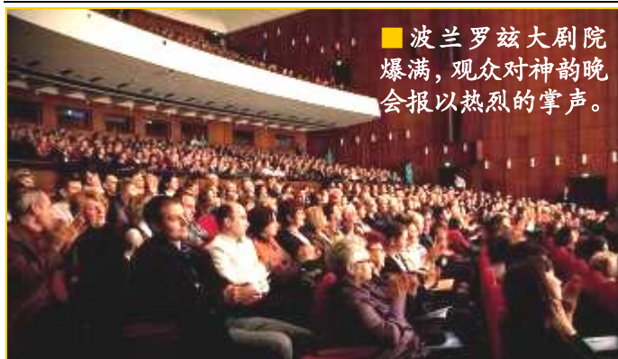
■波兰罗兹大剧院爆满，观众对神韵晚会报以热烈的掌声。