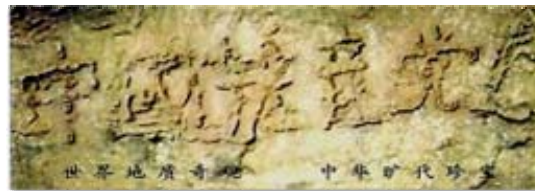
■ 贵州平塘县掌布乡的“藏字石”。

其牺牲品，只有声明退出中共的组织才能废除毒誓，才能在大劫难中保住性命，世界各国有很多古老而著名的预言都提到了当今正在发生的事;2002年6月，贵州平塘县掌布乡发现了2亿7千万年前的藏字石，巨石断面上天然形成六个大字：中国共产党亡(下图)。所以，善待法轮大法，认清中共，退出中共党、团、队，会给自己开创美好的未来。在真相大显之前，每个人还有机会选择自己的未来。