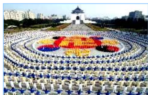
■ 2005 年 12 月 25 日，台湾 4000 多名法轮功学员集体炼功，排组法轮图形。

● 洪传世界 法轮功已洪传世界 80 多个国家和地区，受到世界人民的爱戴和尊敬；给中国赢得巨大的国际声誉。李洪志先生和法轮大法对人类身心健康作出的杰出贡献，获得各国政府褒奖、支持议案信函超过 2977 项。自 2000 年起，李洪志先生连续四年被提名诺贝尔和平奖。