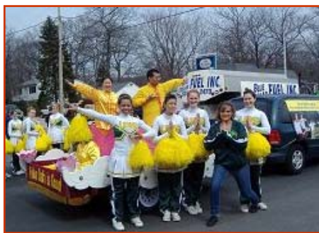
高中生兴奋地 和法轮功学员合影留念

在周末的游行中，许许多多观众向法轮功学员挥手和鼓掌，不少居民拿起照像机拍摄下这难忘的美好瞬间。许多人高呼法轮大法，有的大喊“我爱中国人”，有人跑到队伍中要资料，有人模仿炼功动作，也有中国人向法轮功学员们竖起大拇指。◇