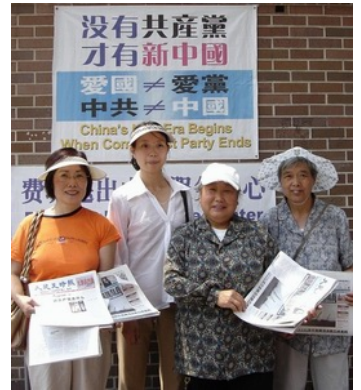
● 美国纽约费城“退出中共服务中心”的义工们

(续前页) 为此，“追查国际”要求各级法院、检察院的工作人员、上级单位的相关人员、受害者及其家属、其他知情者收集并提供以下消息和证据：从 1999 年 7 月 20 日以来该法院公开和不公开审理过的和法轮功有关的案例（包括不是法轮功学员但由于各种与法轮功有关的原因，如分发法轮功真相资料、为法轮功申张正义及与法轮功学员有亲属关系等，被作为法轮功相关案例审判的）。【具体要求从略】