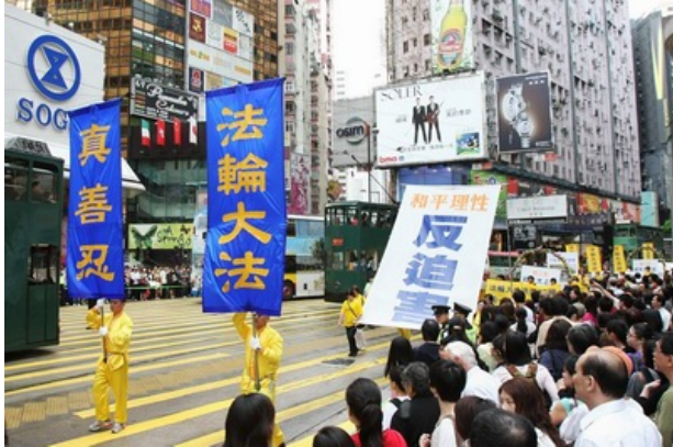
● 纪念 4.25 和平上访十周年，香港和来自台湾、日本及东南亚等地的法轮功学员集会大游行