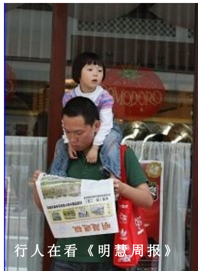
行人在看《明慧周报》