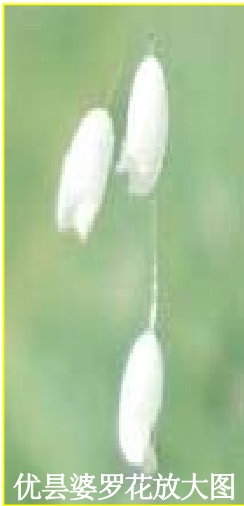
优昙婆罗花放大图

后来关于转轮圣王和优昙婆罗花的事情释迦牟尼佛讲过很多次，在此限于篇幅就不一一细写了。