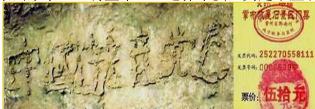
2002年6月在贵州平塘县发现的“藏字石”，断面上天然形成六个大字：中国共产党亡。专家鉴定该巨石有二亿七千万年历史。图为风景区门票。

过后不久的一天，母亲突然来电话，说父亲被大货车撞了，骑的三轮车都撞散架了，人是从车底下被拽出来的。我急忙赶到医院，看见父亲坐在医院楼道的椅子上，正跟医生开玩笑哪。我一看父亲浑身连块皮儿都没破。医院的CT检查结果出来了，一切正常。三退保平安，真是不虚啊！