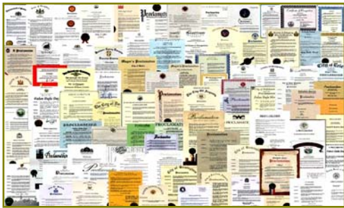
■法轮大法获各国政府褒奖、支持议案信函 2977 项(至 2009 年 3 月)。

在这些现象的背后有没有深层的原因？有心人会发现许多问题，如：手无寸铁的法轮功为什么能抵挡住中共不