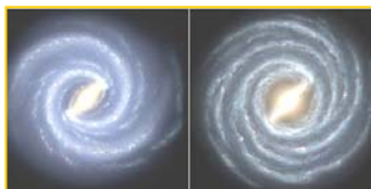
左图：银河系的目前结构 右图：较早的银河系图像 2008年，天文学家接连发布惊人发现：银河系丢失两个主螺旋臂、太阳正在被银河系抛离诞生地。

十年前的1999年7月22日，中共开始了对法轮功的全面迫害，近百万法轮功学员被非法劳教、判刑，遭受了上百种酷刑折磨；已知姓名的就有三千多人被迫害致死，更有数以万计的人被活摘器官倒卖牟利、焚尸灭