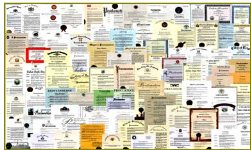
■法轮大法获各国政府褒奖、支持议案信函 2977 项(至 2009 年 3 月)。

在这些现象的背后有没有深层的原因？有心人会发现许多问题，如：手无寸铁的法轮功为什么能抵挡住中共不计后果的血腥迫害？没有任何政治目的和背景的法轮功为什么能在世界上快速流传？为什么这么多不同族裔的人坚定的修炼？……这些问题，愿每个人都能认真思考，都能从心底找到答案。