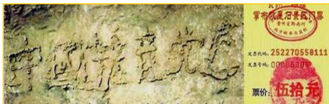
2002年6月在贵州平塘县发现的“藏字石”，断面上天然形成六个大字：中国共产党亡。专家鉴定该巨石有二亿七千万年历史。图为风景区门票。

过后不久的一天，母亲突然来电话，说父亲被大货车撞了，骑的三轮车都撞散架了，人是从车底下被拽出来的。我急忙赶到医院，看见父亲坐在医院楼道的椅子上，正跟医生开玩笑哪。我一看父亲浑身连块皮儿都没破。医院的CT检查结果出来了，一切正常。三退保平安，真是不虚啊！