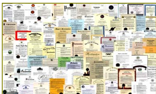
■法轮大法获各国政府褒奖、支持议案信函 2977 项(至 2009 年 3 月)。

在这些现象的背后有没有深层的原因？有心人会发现许多问题，如：手无寸铁的法轮功为什么能抵挡住中共不