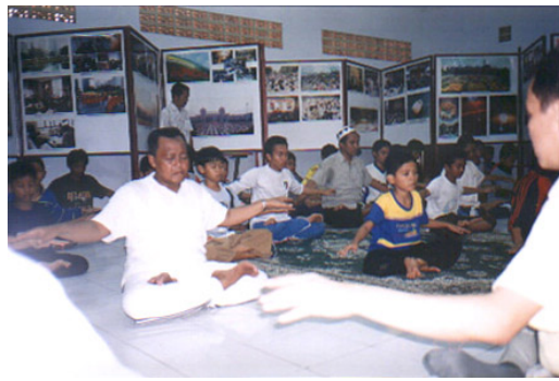
国会议员、回教首领合吉长老学炼神通加持法。