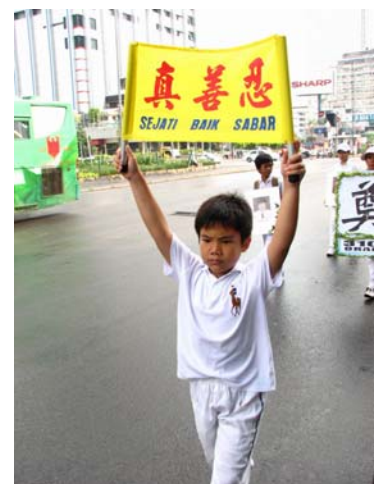
图二：高举“真善忍”的法轮功小弟子在游行中