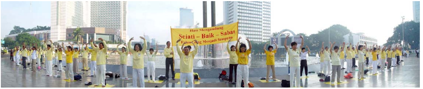
二零零二年三月三日，法轮功学员在雅加达省中心最大的喷水池（Bundaran Hote）圆周炼功。