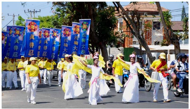
二零零八年八月九日，一千多名印尼和亚太地区法轮功学员在巴厘岛举行了盛大游行。