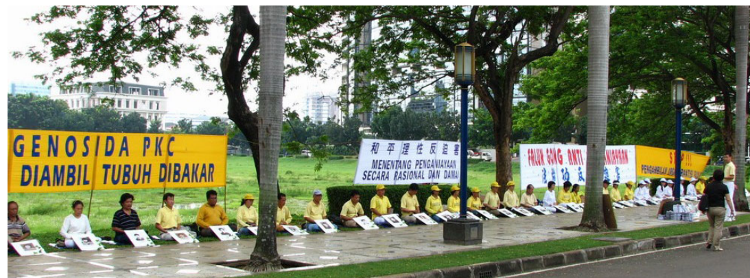
二零零七年十二月八日，印尼法轮功学员参加了国际人权日的游行活动。