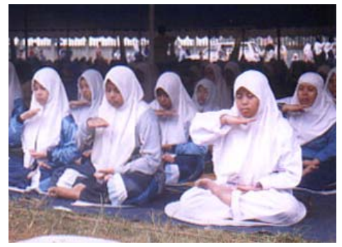
回教徒信女学炼神通加持法