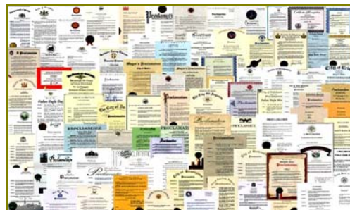
■法轮大法获各国政府褒奖、支持议案信函 2977 项(至 2009 年 3 月)。