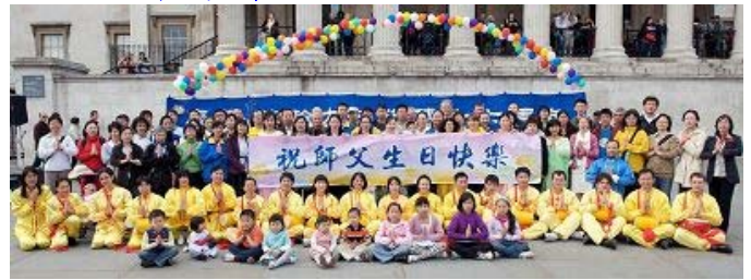
英国大法弟子恭祝师尊生日快乐