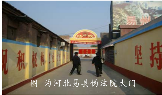
图为河北易县伪法院大门