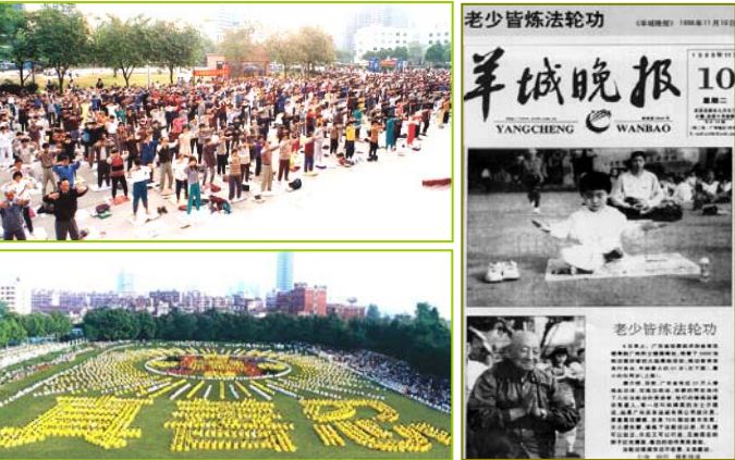
左上/1998 年北京法轮功学员晨炼。这样的炼功场面在 1999 年 7 月前在中国城市乡村随处可见。 左下/1997 年武汉 5000 多法轮功学员炼功组字。 右/《羊城晚报》报道《老少皆炼法轮功》(1998.11.10)