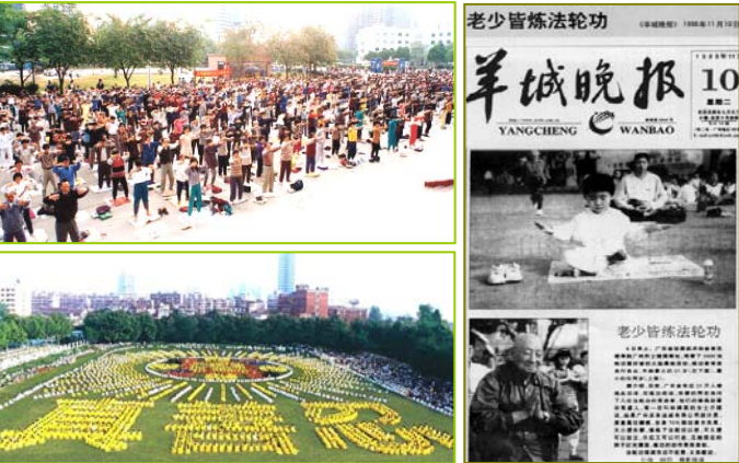
左上/1998 年北京法轮功学员晨炼。这样的炼功场面在 1999 年 7 月前在中国城市乡村随处可见。 左下/1997 年武汉 5000 多法轮功学员炼功组字。 右/《羊城晚报》报道《老少皆炼法轮功》(1998.11.10)