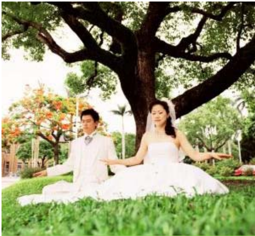
东旭和心权练习法轮功

《转法轮》一书中所讲的无病无痛的美妙感觉。”再进一步修炼下去，心权更了解法轮功不只是可以让人身体健康，更使人在心