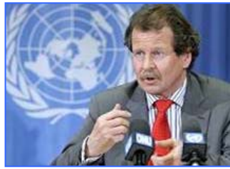
联合国人权委员会酷刑问题专员诺瓦克先生

2008年11月21日，联合国要求中共立即组成独立调查团，对法轮功学员受到酷刑虐待甚至被活摘器官的指控进行调查，并要求对参与迫害的责任人绳之以法。