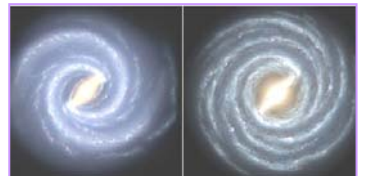
左图：银河系的目前结构 右图：较早的银河系图像 2008 年，天文学家接连发布惊人发现：银河系丢失两个主螺旋臂、太阳正在被银河系抛离诞生地。根据玛雅预言，我们现在处于整个宇宙和地球新陈代谢的更新期。