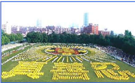
▲5000 多名武汉法轮功学员集体炼功，排组法轮图形和“真善忍”。(1997)

● 法轮大法至今已洪传世界114多个国家和地区，获得各国政府褒奖、支持议案、信函超过3000多项。法轮大法的主要著作《转法轮》已被译成38种文字，在全世界出版发行。