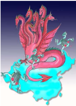
圣经启示录描述一条“大红(赤)龙，七头十角，七头上戴着七个冠冕。

从形式上看，大法弟子劝“三退”（退党、退团、退队）过程中并没有鼓动人们必须去找党组织正式提出申请，而是注重于人的心理活动，从