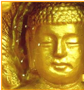
佛像上的白色小花即优昙婆罗花

1997年，韩国媒体首次报导了清溪寺出现优昙婆罗花，引起佛教界的惊喜。之后，世界各地纷纷传出了优昙婆罗花开放的消息。