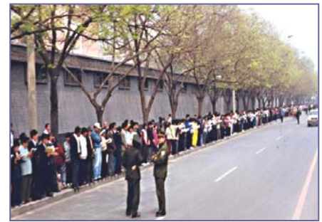
法轮功学员文明安静，警察不用维持秩序，在一旁聊天。学员背后不是中南海红墙，所谓的“围攻中南海”根本不存在。

4•25当晚，江泽民出于妒忌，强行推翻政府总理的开明决定，把和平上访歪曲成“围攻中南海”，并于99年7月开始全面迫害法轮功。