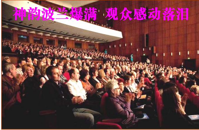
神韵波兰爆满 观众感动落泪

看到这，不由想到：法轮功学员告诉世人“天灭共产邪党”，那真的是他们出于慈悲而向大家明言了未来的劫数，他们劝人退党、团、队，那真的是在救人啦。大家千万不要象故事中的当地居民那样因为不相信而遭灾呀。现在就让我们赶快声明退出党、团、队保平安吧！（文/陆文）