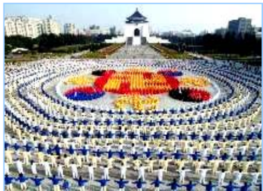
◀ 2005 年 12 月 25 日，台湾 4000 多名法轮功学员集体炼功，排组法轮图形。

● 洪传世界 法轮功已洪传世界 80 多个国家和地区，受到世界人民的爱戴和尊敬。因李洪志先生和法轮大法对人类身心健康作出的杰出贡献，获得各国政府褒奖、支持议案信函超过 2977 项。法轮功书籍被译成 30 多种语言全球发行。