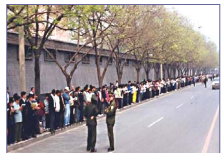
法轮功学员文明安静，警察不用维持秩序，在一旁聊天。学员背后不是中南海红墙，所谓的“围攻中南海”根本不存在。

4•25当晚，江泽民出于妒忌，强行推翻政府总理的开明决定，把和平上访歪曲成“围攻中南海”，并于99年7月开始全面迫害法轮功。