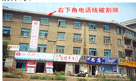
师父长春的家（造谣媒体中报道的豪宅）

“前几年国内电视上造谣说师尊有‘豪宅’。那根本不是师尊的家。”“师尊在东北也没有象样的住宅。师尊一家住在长春市解放大路一栋陈旧的简易楼里。有一次，电线着火，左邻右舍都被火烧了，唯独师尊家安然无恙。这件事情当时在学员中流传甚广，大家都觉得很神奇。”