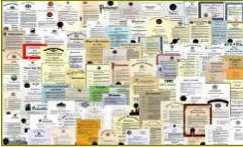
■ 法轮大法获各国政府褒奖、支持 议案信函超过 3000 项。

对于法轮功学员来说，他们找到了答案认识到了生命的价值和意义。法轮功教导的“真善忍”超越了种族、国界和文化，在世界上广为流传，其实这不仅是法轮功学员的骄傲，也是中国人的骄傲，是人类的福气。