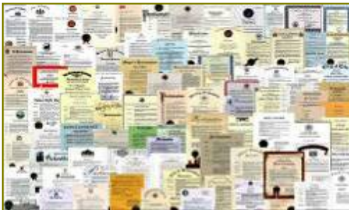
■ 法轮大法获各国政府褒奖、支持 议案信函超过 3000 项。

对于法轮功学员来说，他们找到了答案认识到了生命的价值和意义。法轮功教导的“真善忍”超越了种族、国界和文化，在世界上广为流传，其实这不仅是法轮功学员的骄傲，也是中国人的骄傲，是人类的福气。