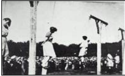
[照片：纽伦堡国际战犯法庭经过对纳粹集中营死亡护士组在对犹太人的种族灭绝中所犯罪行的认定，于1946年对她们执行死刑。]

实际上翻开过去不长的历史，理智的去思考一下就可以拨开迷雾，找到正确的道路。一九四五年的纽伦堡国际军事法庭的审判，已经警示着后人：哪怕是上级命