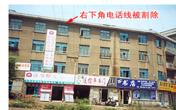
师父在长春的家，位于建设街和解放大路交汇路口西北角，面积20多平方米。

“92年到93年底，师父参加了北京举办的‘东方健康博览会’，师父在博览会期间创造了许多奇迹。一位男学员，30多岁，弓腰90°，经师父现场给他