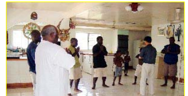
■南太平洋岛国—巴布亚新几内亚前副总理及家人学炼法轮功