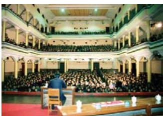
93年3月，李洪志先生在武汉第二期传授班上讲法传功

每个和师父接触过的学员都见证了师父的俭朴和言传身教：师父在大陆的家是简易楼房，冬天没有暖气；师父里面穿的羊毛衫是打了补丁的；师父给女儿每月100元生活费；办班期间，师尊听说经济困难的弟子吃的是方便面时落泪了。而师父自己却为了把美好的功法传给更多人，奔波于全国各地，两年多办班54次，有时睡在火车地板上，整年吃着方便面，1995年开始到海外传法时依然吃着方便面。在师父的身上，我们懂得了什么叫真正的“无私无我”，在师父的身上我们学会怎样才是“真善忍”。即便是在最黑暗的时候，面对着酷刑与迫害，每当想起师父为我们付出的一切，