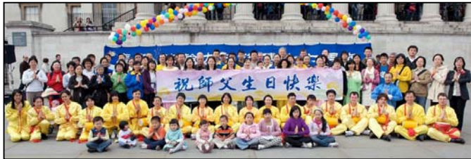
英国大法弟子庆祝第十届世界法轮大法日，并恭祝师尊五十八周岁生日快乐

身体糟透了，一身都是病，整天靠吃药打针度日，等于是活不如死。有幸在十年前有机缘学炼法轮功，没多久就脱胎换骨般的病痛全消，非常感谢师尊的慈悲与恩赐。◇