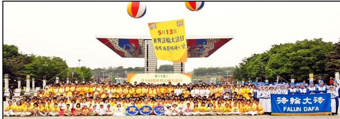
韩国法轮功学员以各种形式庆祝世界法轮大法日，并恭贺师尊生日快乐