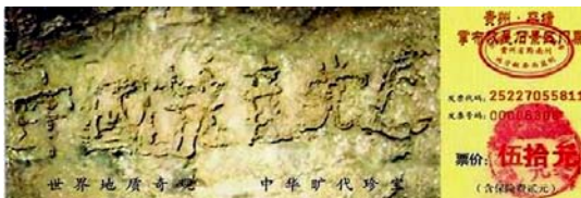
贵州省平塘县掌布乡风景区门票上藏字石的照片