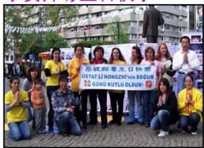
土耳其大法弟子恭祝师尊生日快乐