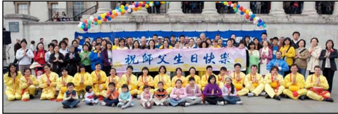
英国大法弟子庆祝第十届世界法轮大法日，并恭祝师尊五十八周岁生日快乐

身体糟透了，一身都是病，整天靠吃药打针度日，等于是活不如死。有幸在十年前有机缘学炼法轮功，没多久就脱胎换骨般的病痛全消，非常感谢师尊的慈悲与恩赐。◇