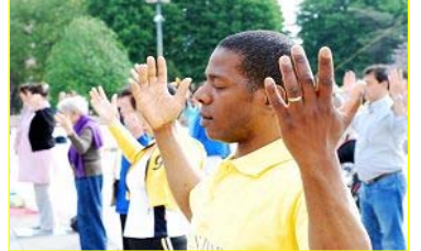
■“真善忍”的巨大威德和感召力超越国界，受到各族裔的珍视。图为今年五月法国法轮功学员在庆祝活动中集体炼功。