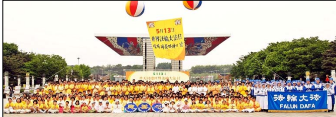
韩国法轮功学员以各种形式庆祝世界法轮大法日，并恭贺师尊生日快乐