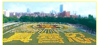
■一九九八年，武汉，五千多名法轮功学员集体炼功。

◎ 法轮大法以宇宙特性“真善忍”指导人修心向善，从根本上祛除病疾、净化身心，给人指出一条返本归真的路。在短短的七年里，因其神奇功效，迅速传遍神州大地，修者上亿。