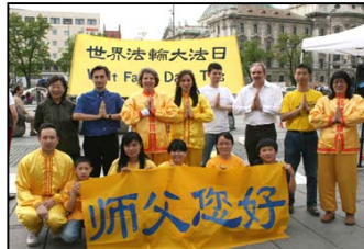
慕尼黑大法弟子向师父问好