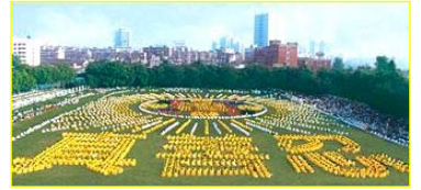
■一九九八年，武汉，五千多名法轮功学员集体炼功。

◎ 法轮大法以宇宙特性“真善忍”指导人修心向善，从根本上祛除病疾、净化身心，给人指出一条返本归真的路。在短短的七年里，因其神奇功效，迅速传遍神州大地，修者上亿。