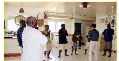
■南太平洋岛国—巴布亚新几内亚前副总理及家人学炼法轮功