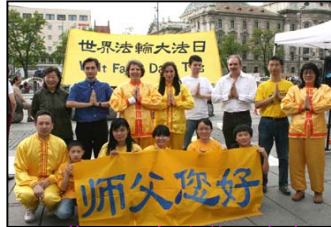
慕尼黑大法弟子向师父问好