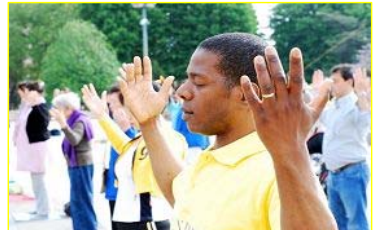
■“真善忍”的巨大威德和感召力超越国界，受到各族裔的珍视。图为今年五月法国法轮功学员在庆祝活动中集体炼功。