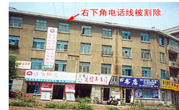
师父在长春的家，位于建设街和解放大路交汇路口西北角，面积20多平方米。

“92年到93年底，师父参加了北京举办的‘东方健康博览会’，师父在博览会期间创造了许多奇迹。一位男学员，30多岁，弓腰90°，经师父现场给他