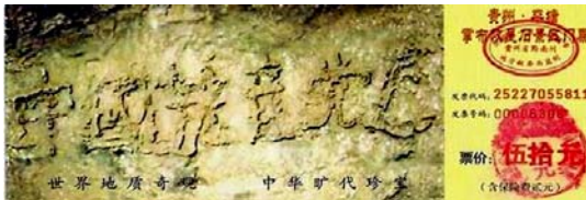
贵州省平塘县掌布乡风景区门票上藏字石的照片