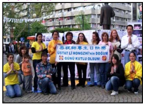
土耳其大法弟子恭祝师尊生日快乐