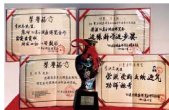
1993 年 12 月，东方健康博览会授予李洪志先生的奖状

法轮功又名法轮大法，是由李洪志先生于 1992 年 5 月传出的佛家上乘修炼大法，以宇宙最高特性“真、善、忍”为标准修炼人的心性、做好人。对提高人的道德水准、去病健身有着神奇的功效，所以修炼者不乏全国各阶层人士，教授、专家、学者云集。1993 年 12 月在北京东方健康博览会上，李洪志先生获博览会最高奖“ 边缘科学进步奖 ”和大会的 特别金奖 ，以及“ 受群众欢迎气功师 ”称号。1995 年出版的法轮功主要著作《转法轮》于 1996 年 1 月被《北京青年报》评为北京市十大畅销书。