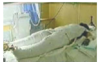
央视《焦点访谈》中的“自焚者”被包裹得严密。