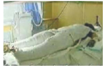
央视《焦点访谈》中的“自焚者”被包裹得严密。