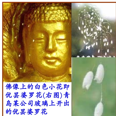
佛像上的白色小花即 优昙婆罗花(右图)青 岛某公司玻璃上开出的 优昙婆罗花