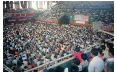
图为莱西市体育馆，由 4500 多人参加的心得交流会，洪大的场面祥和而慈悲。整个体育馆内座无虚席，有的只好站在门口听。

头天下午，我们就将积满垃圾的体育馆打扫干净。交流会那天，我们炼完功，很多学员顾不上吃饭，就到体育馆了。只看到体育场大院，有