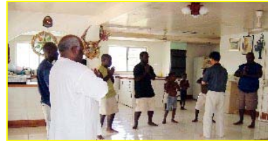
■ 南太平洋岛国—巴布亚新几内亚前副总理及家人学炼法轮功。