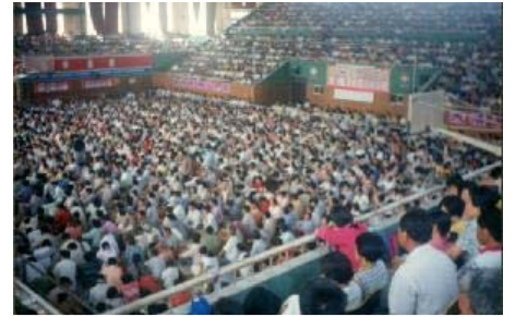
图为莱西市体育馆，由 4500 多人参加的心得交流会，洪大的场面祥和而慈悲。整个体育馆内座无虚席，有的只好站在门口听。

头天下午，我们就将积满垃圾的体育馆打扫干净。交流会那天，我们炼完功，很多学员顾不上吃饭，就到体育馆了。只看到体育场大院，有