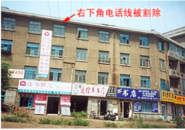
师父长春的家（造谣媒体中报导的豪宅）

❁“前几年国内电视上造谣说师尊有“豪宅”。那根本不是师尊的家。”“师尊在东北也没有象样的住宅。师尊一家住在长春市解放大路一栋陈旧的简易楼里。有一次，电线着火，左邻右舍都被火烧了，唯独师尊家安然无恙。这件事情当时在学员中流传甚广，大家都觉得很神奇。”