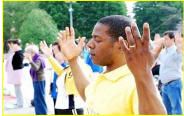
■ “真善忍”巨大威德和感召力超越国界，受到各族裔的珍视。图为今年五月法国法轮功学员在庆祝活动中集体炼功。