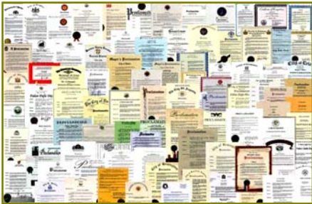
■法轮大法获各国政府褒奖、支持 议案信函超过 3000 项。

在古老的佛国印度，大城市都有炼功点，仅班加罗尔就有八十多所学校师生修炼法轮功，学生在体育课集体炼功，法轮大法主要著作《转法轮》中的《论语》还被纳入学校英文教材的卷首；很多偏僻地区的学校的师生也集体修炼法轮功。◇