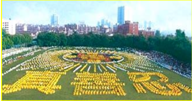
■ 一九九八年，武汉，五千多名法轮功学员集体炼功。