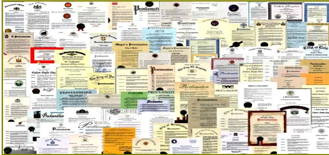
■ 法轮大法获各国政府褒奖、支持议案信函 3000 多项。

非洲： 南非 埃及 毛里求斯 纳米比亚 乌干达 108 肯亚 坦桑尼亚 埃塞俄比亚 苏丹 刚果 突尼斯 摩洛哥