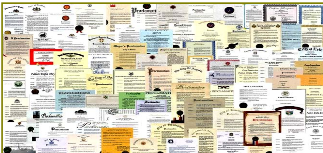
■ 法轮大法获各国政府褒奖、支持议案信函 3000 多项。

非洲： 南非 埃及 毛里求斯 纳米比亚 乌干达 108 肯亚 坦桑尼亚 埃塞俄比亚 苏丹 刚果 突尼斯 摩洛哥