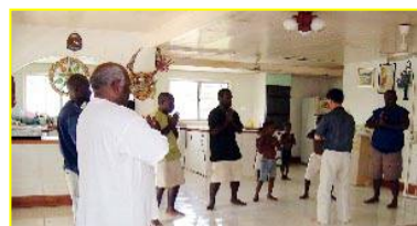
■南太平洋岛国—巴布亚新几内亚前副总理及家人学炼法轮功。

家庭组成的。象三年灾害的时候，老百姓的命都饿没了，中华民族能好得了吗？历史的教训啊。今天邪灵垮了，只是主张“假恶暴”的共产党垮了，国家还是国家。中共不等于中国。一个没人纵容、推行“假恶暴”的民族，老百姓日子只能过得更好。