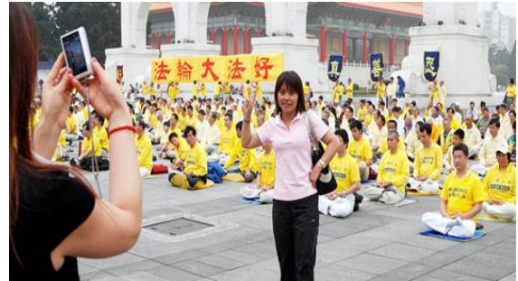
最有纪念价值的留影

2009年4月25日下午，来自台北市及周边的千名法轮功学员在台北市“自由广场”前，以集体炼功来纪念“四二五”十周年。活动进行中，有五、六辆载着大陆旅客的大巴士来到。当看到写着“法轮大法好”和“真善忍”的大横幅及千名穿着黄衣服的法轮功学员时，大部份中国游客在惊讶之余，都立刻拿起相机