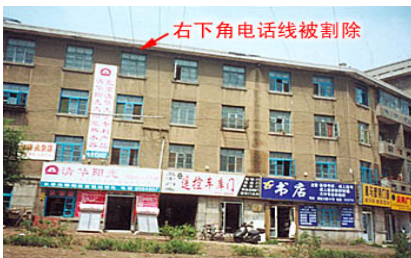
师父长春的家（造谣媒体中报道的豪宅）

❖ “师尊为了减轻学员负担，并使更多人受益，办班收费很低，北京的班，新学员 40 元，老学员 20 元，这在当时各种气功班中是最低的了。办班所收的学费中，有很大一部份要交给主办单位，其余，除去到各地办班的食宿费、往返车费，以及部份工作人员