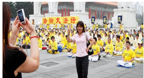
最有纪念价值的留影

2009年4月25日下午，来自台北市及周边的千名法轮功学员在台北市“自由广场”前，以集体炼功来纪念“四二五”十周年。活动进行中，有五、六辆载着大陆旅客的大巴士来到。当看到写着“法轮大法好”和“真善忍”的大横幅及千名穿着黄衣服的法轮功学员时，大部份中国游客在惊讶之余，都立刻拿起相机