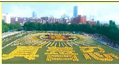
■一九九八年，武汉，五千多名法轮功学员集体炼功。

◎ 各国、各地政府和团体组织纷纷颁发褒奖、通过支持议案，及宣布“法轮大法月”、“法轮大法周”和“法轮大法日”，以各种形式支