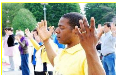
■“真善忍”巨大威德和感召力超越国界，受到各族裔的珍视。图为今年五月法国法轮功学员在庆祝活动中集体炼功。