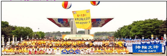
韩国法轮功学员以各种形式庆祝世界法轮大法日，并恭贺师尊生日快乐