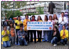
土耳其大法弟子恭祝师尊生日快乐