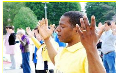
■“真善忍”的巨大威德和感召力超越国界，受到各族裔的珍视。图为今年五月法国法轮功学员在庆祝活动中集体炼功。