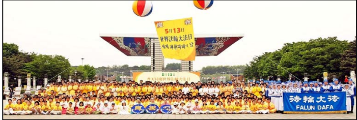
韩国法轮功学员以各种形式庆祝世界法轮大法日，并恭贺师尊生日快乐