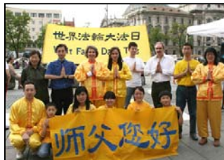
慕尼黑大法弟子向师父问好

公义，这在当时看来不符合社会现实。出于仁爱，基督徒拒绝进入竞技场观看战犯与奴隶肉搏至死，他们将自己的奴隶无条件释放。不少教父批评罗马人奢华逸乐的生活方式，引起一些人很大不满。基督徒纯洁的个人生活与普遍堕落、奢靡的社会氛围形成一种强烈对照，使很多人尤其是当权者感到一种很大的威胁。