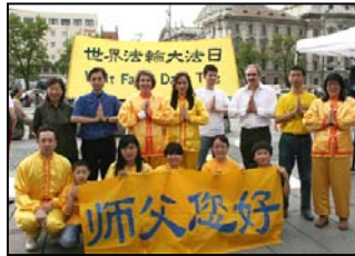
慕尼黑大法弟子向师父问好

于是活不如死。有幸在十年前有机缘学炼法轮功，没多久就脱胎换骨般的病痛全消，非常感谢师尊的慈悲与恩赐。