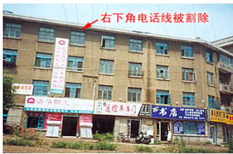
师父在长春的家，位于建设街和解放大路交汇路口西北角，面积20多平方米。

“92年到93年底，师父参加了北京举办的‘东方健康博览会’，师父在博览会期间创造了许多奇迹。一位男学员，30多岁，弓腰90°，经师父现场给他调整身体，随着脊椎骨咔咔作响，慢慢腰直起来了，