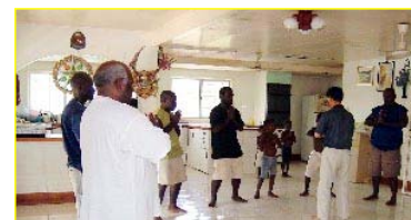
■南太平洋岛国一巴布亚新几内亚前副总理及家人学炼法轮功