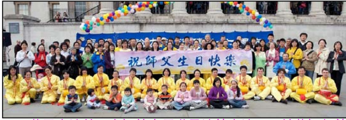
英国大法弟子庆祝第十届世界法轮大法日，并恭祝师尊五十八周岁生日快乐

于是活不如死。有幸在十年前有机缘学炼法轮功，没多久就脱胎换骨般的病痛全消，非常感谢师尊的慈悲与恩赐。