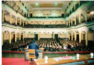
93年3月，李洪志先生在武汉第二期传授班上讲法传功

每个和师父接触过的学员都见证了师父的俭朴和言传身教：师父在大陆的家是简易楼房，冬天没有暖气；师父里面穿的羊毛衫是打了补丁的；师父给女儿每月100元生活费；办班期间，师尊听说经济困难的弟子吃的是方便面时落泪了。而师父自己却为了把美好的功法传给更多人，奔波于全国各地，两年多办班54次，有时睡在火车地板上，整天吃着方便面，1995年开始到海外传法时依然吃着方便面。在师父的身上，我们懂得了什么叫真正的“无私无我”，在师父的身上我们学会怎样才是“真善忍”。即便是在最黑暗的时候，面对着酷刑与迫害，每当想起师父为我们付出的一切，每当想起师父慈悲与鼓励的目光，我们便获得了无量的、战胜一切邪恶的力量。