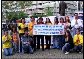
土耳其大法弟子恭祝师尊生日快乐