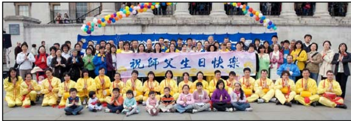
英国大法弟子庆祝第十届世界法轮大法日，并恭祝师尊五十八周岁生日快乐

于是活不如死。有幸在十年前有机缘学炼法轮功，没多久就脱胎换骨般的病痛全消，非常感谢师尊的慈悲与恩赐。