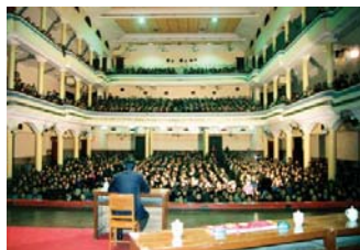
93年3月，李洪志先生在武汉第二期传授班上讲法传功

每个和师父接触过的学员都见证了师父的俭朴和言传身教：师父在大陆的家是简易楼房，冬天没有暖气；师父里面穿的羊毛衫是打了补丁的；师父给女儿每月100元生活费；办班期间，师尊听说经济困难的弟子吃的是方便面时落泪了。而师父自己却为了把美好的功法传给更多人，奔波于全国各地，两年多办班54次，有时睡在火车地板上，整天吃着方便面，1995年开始到海外传法时依然吃着方便面。在师父的身上，我们懂得了什么叫真正的“无私无我”，在师父的身上我们学会怎样才是“真善忍”。即便是在最黑暗的时候，面对着酷刑与迫害，每当想起师父为我们付出的一切，每当想起师父慈悲与鼓励的目光，我们便获得了无量的、战胜一切邪恶的力量。