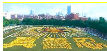
■一九九八年，武汉，五千多名法轮功学员集体炼功。