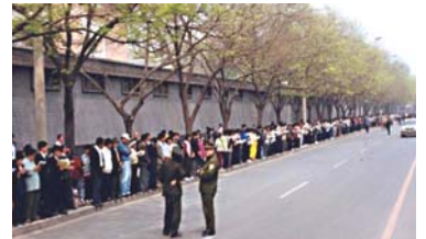
法轮功学员文明安静，警察不用维持秩序，在一旁聊天。学员背后不是中南海红墙，所谓的“围攻中南海”根本不存在。

4·25当晚，江泽民出于妒忌，强行推翻政府总理的开明决定，把和平上访歪曲成“围攻中南海”，并于1999年7月开始全面迫害法轮功。◇