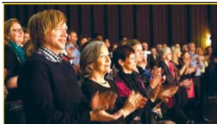
▲ 意犹未尽的挪威观众。▶ 3月25日,台湾的39场神韵演出圆满落幕。民进党主席蔡英文致花篮祝贺。