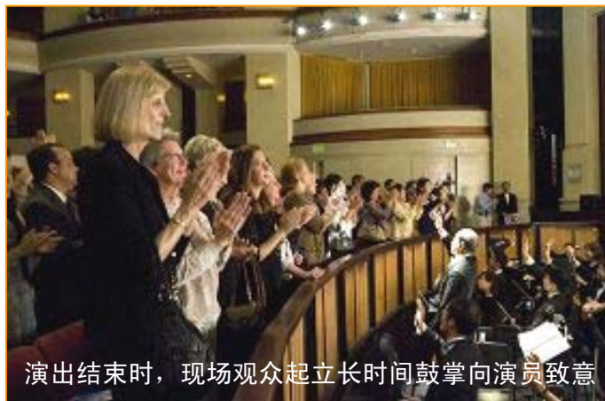
演出结束时，现场观众起立长时间鼓掌向演员致意

【明慧网】神韵巡回艺术团于二零零九年五月二十七日，继续在圣地亚哥加州艺术中心，上演二场“春之旅”晚会，吸引此地各族裔观众前来观看。