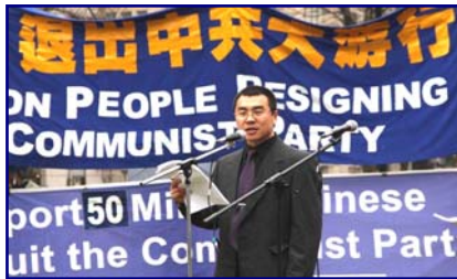
李凤智在退党集会上

2009年3月15日下午，旅居美国前中共国安部对外谍报官李凤智在华盛顿中共驻美国大使馆前公开声明退党。李凤智说：“我今天站在这里，背对中国大使馆，郑重宣布与中共彻底决裂，这是经过我长期的、认真的反思和思