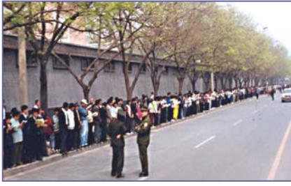
法轮功学员文明安静，警察不用维持秩序，在一旁聊天。

出于对政府的信任，法轮功学员 4 月 25 日自发来到国务院信访办。当日，在国务院总理的直接关注下，合理解决了天津暴力抓人事件。晚上学员们散去时，地上一片纸屑都没有，连警察扔的烟