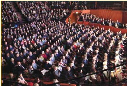
▲ 瑞典斯德哥尔摩 Cirkus 大剧场爆满。▶ 澳洲堪培拉观众为神韵倾倒。