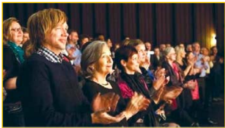
▲ 意犹未尽的挪威观众。▶ 3月25日,台湾的 39 场神韵演出圆满落幕。民进党主席蔡英文致花篮祝贺。