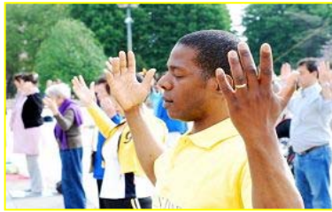
■ “真善忍”巨大威德和感召力超越国界，受到各族裔的珍视。图为今年五月法国法轮功学员在庆祝活动中集体炼功。