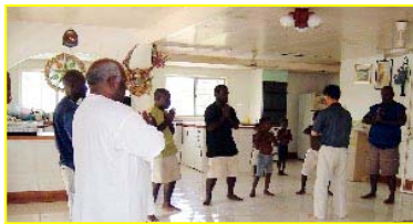
■ 南太平洋岛国—巴布亚新几内亚前副总理及家人学炼法轮功。