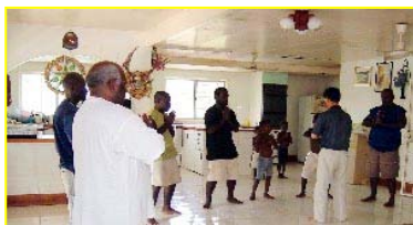
■ 南太平洋岛国—巴布亚新几内亚前副总理及家人学炼法轮功。