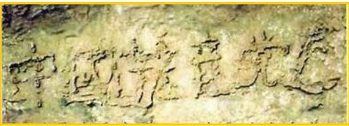
■ 二 零 零 二 年 六 月，贵州省平塘县风景区惊

真是人逢喜事精神爽。没想到老爸这一退党，竟然退掉了使他犯愁了好几年的老毛病。他退党后没过几天，人就痊愈出院了。到零九年五月，三年过去了，老爸再也没犯过这种稀奇古怪的老毛病。