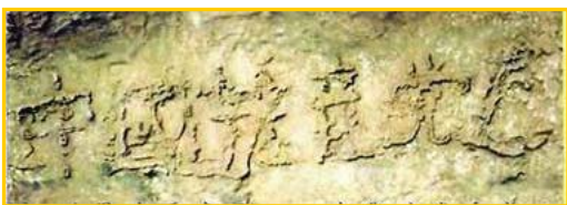
■ 二零零二年六月，贵州省平塘县风景区惊

真是人逢喜事精神爽。没想到老爸这一退党，竟然退掉了使他犯愁了好几年的老毛病。他退党后没过几天，人就痊愈出院了。到零九年五月，三年过去了，老爸再也没犯过这种稀奇古怪的老毛病。