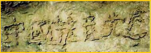
■二零零二年六月，贵州省平塘县风景区惊

真是人逢喜事精神爽。没想到老爸这一退党，竟然退掉了使他犯愁了好几年的老毛病。他退党后没过几天，人就痊愈出院了。到零九年五月，三年过去了，老爸再也没犯过这种稀奇古怪的老毛病。