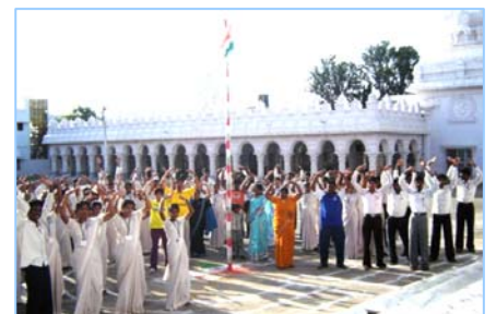
■ 在印度班加罗尔炼功 (2009.5)