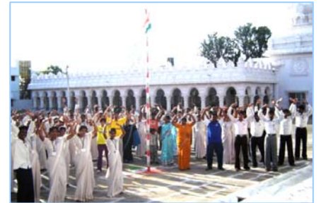
■ 在印度班加罗尔炼功 (2009.5)