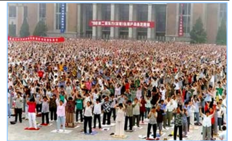
■ 沈阳万名法轮功学员集体炼功 (1998年)。

在古老的佛国印度，大城市都有炼功点，仅班加罗尔就有八十多所学校师生修炼法轮功，学生在体育课集体炼功，法轮大法主要著作《转法轮》中的《论语》被纳入学校英文教材的卷首。