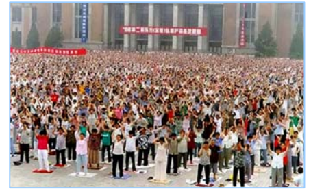
■ 沈阳万名法轮功学员集体炼功 (1998年)。

在古老的佛国印度，大城市都有炼功点，仅班加罗尔就有八十多所学校师生修炼法轮功，学生在体育课集体炼功，法轮大法主要著作《转法轮》中的《论语》被纳入学校英文教材的卷首。