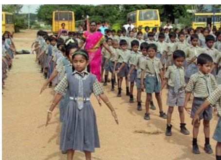
■“真善忍”的巨大威德和感召力超越国界，受到各族裔的珍视。图为印度师生在炼功。