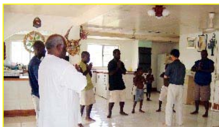
■南太平洋岛国—巴布亚新几内亚前副总理及家人学炼法轮功