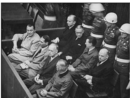
图：纽伦堡审判历史图片

人从事超强度的劳役，在将他们的体力耗尽后再赶往集中营从肉体上消灭。600 万犹太人就是这样分步骤被屠杀的。因此所有纳粹战犯都有理由说：杀人是在执行法律。