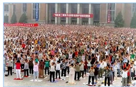
■ 沈阳万名法轮功学员集体炼功（1998年）。

在古老的佛国印度，大城市都有炼功点，仅班加罗尔就有八十多所学校师生修炼法轮功，学生在体育课集体炼功，法轮大法主要著作《转法轮》中的《论语》被纳入学校英文教材的卷首。