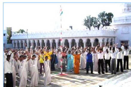
■ 在印度班加罗尔炼功（2009.5）